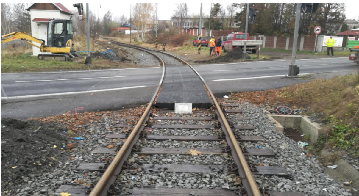
Pohled ve směru staničení