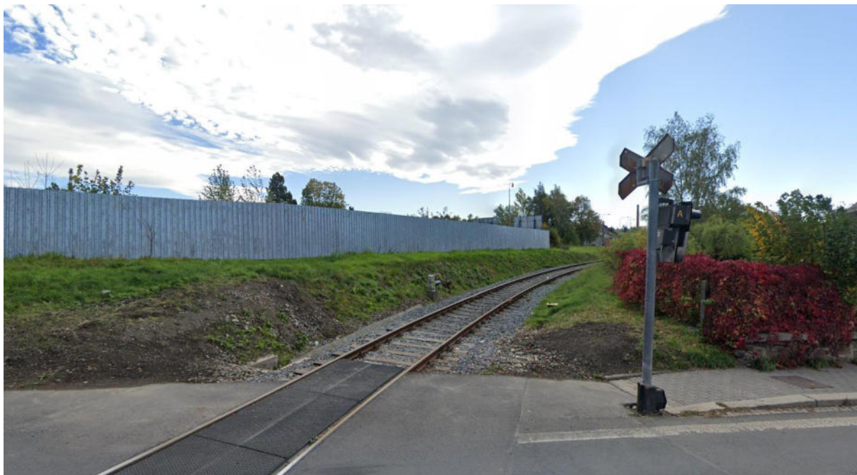
Pohled proti směru staničení